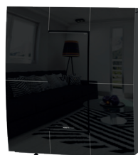
Nero Black - Noir - Negro - Schwarz