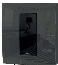
Canna di Fucile Gunmetal - Bronze à Canon Gunmetal - Rotguss