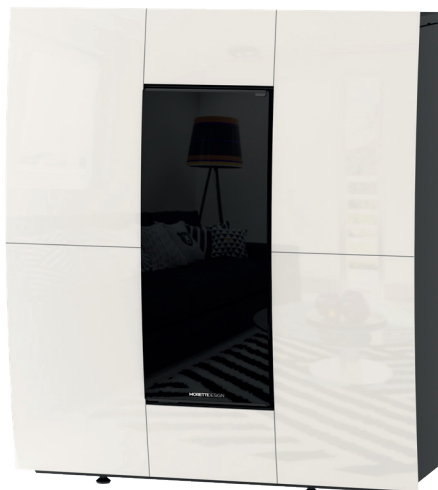
Bianco White - Blanc - Bianco - Weiß