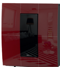
Bordeaux - Bordeaux - Bordeaux - Burdeos -Bordeaux